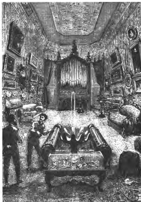
Figura 3. Interior del Nautilus .

ma de petits compartiments estancs, universos reduïts on la comoditat i el confort pal·lien les circumstancials vicissituds que qualsevol viatge comporta (Paumier, 2005).