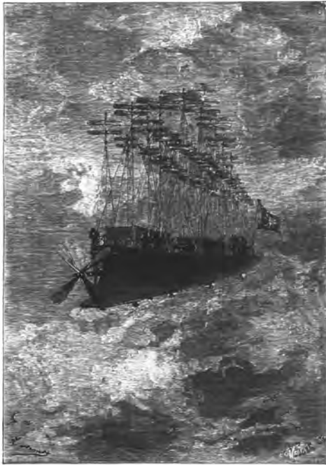
Figura 5. L'Albatros.

singulars utilitzats per a assegurar el domini individual de l'home sobre la natura, per a ampliar els límits naturals i físics de la condició humana. No estan al servei de la gran producció industrial, cosa que no deixa de ser paradoxal en un autor tan penetrat per la ciència del seu temps, caracteritzat per un industrialisme que començava a abandonar la seva fase d'incipiència per a esdevenir l'eix principal de gairebé tota l'activitat humana. En la mateixa direcció, i seguint a Jean Chesneaux, podem afirmar que el maquinisme de Verne no és productor de plusvàlua, d'excedents crematístics seductors, no segueix les directrius del capitalisme acumulador de riquesa que el nostre protagonista, des de la seva condició d'agent de borsa, coneixia tan bé (Chesneaux, 1973).