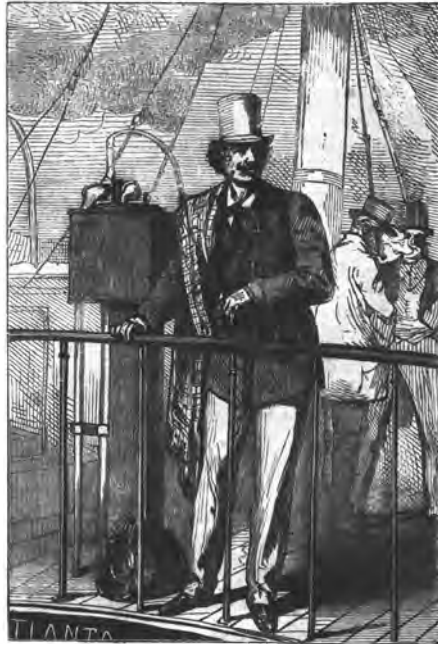
Figura 2. Michel Ardan, transposició literària de Nadar.

revista Le Tour du Monde , 7 una publicació amb molts lectors entre els quals figurava Verne. El punt de partida dels viatgers era el port de Zanzíbar, el mateix punt on començava el viatge amb globus del nostre home. Mentre s'escrivia la novel·la, a més, Speke dirigia una altra expedició per terra que pretenia descobrir les fonts del Nil, un dels grans misteris encara per resoldre, i la solució havia de permetre, segons totes les opinions, desxifrar l'enigma dels orígens de la civilització (Jeal, 2011). Així doncs, la qüestió africana era un tema candent. Una recreació literària d'una exploració que tingués com a objecte imitar les peripecies dels expedicionaris que amb les seves narracions ja havien atrapat l'opinió pública, tenia moltes possibilitats, almenys en principi, de ser ben acollida.