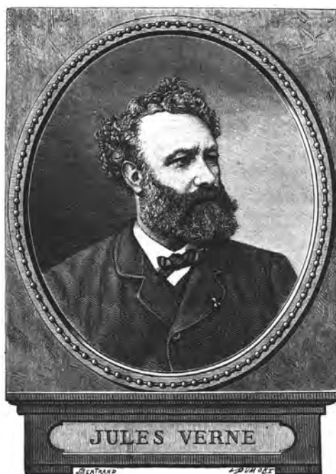
Figura 1. Jules Verne.

els cercles científics, dedicant molt del seu temps a lectures de divulgació científica i emprenent una tasca metòdica de consulta en els fons científics de la Bibliothèque National, amb l'elaboració de fitxes de lectura que constituïran el nucli de la base de dades particulars que li serviran per a fonamentar els arguments de les seves obres.