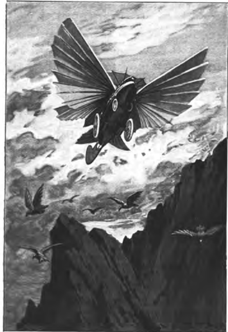
Figura 6. L'Épouvante.